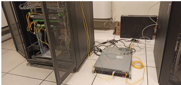
Installation de test avec un serveur et un switch