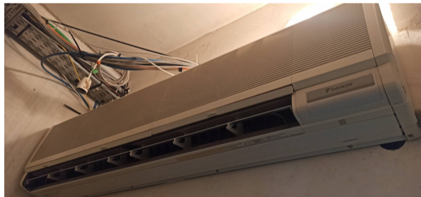
L'ancienne climatisation du 0B