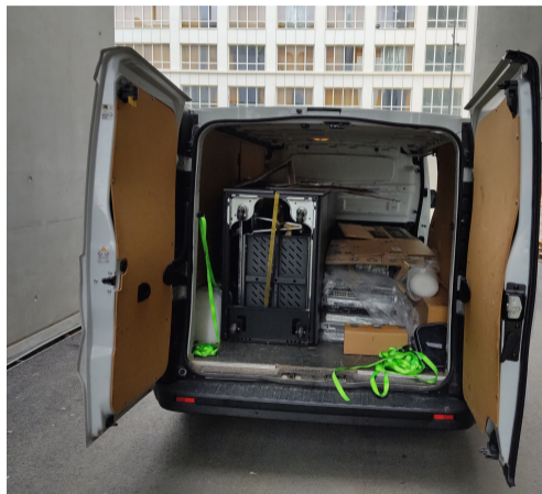
Le Crans dans un camion