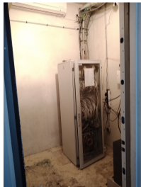
Le 0B, vide