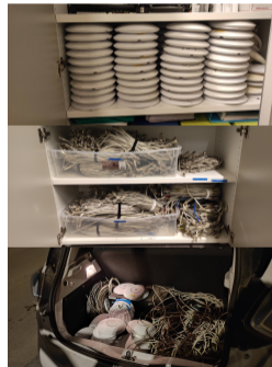
Récupération du matériel de Cachan