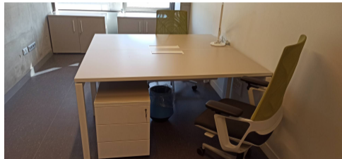
Premier déménagement du 2B