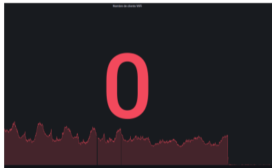
Extinction du réseau du Crans